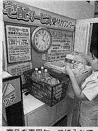
商品を専用ケースに入れて宅配する(東京都中央区のどらっくぱぱす築地店)

ぱぱすの宅配サービスは夜7時までに店頭で注文すれば、30分から3時間程度で自宅に届ける。既に実施している築地店(東京・中央)などでは、高齢者や主婦のほか近隣のオフィスに勤める会社員も利用。大容量のペッ